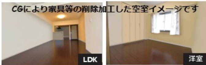
CGにより家具等の削除加工した空室イメージです