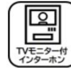
TVモニター付 インターホン